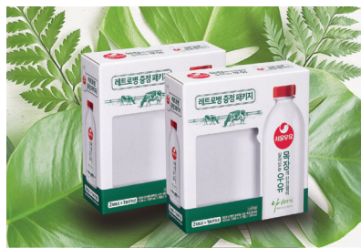
B형 삼면 창문

고객이 필요로 하는 모든 부분을 기획, 제작하여 일관된 컨셉과 디자인의 토탈 패키지를 제공합니다.