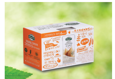
B형 삼면 창문