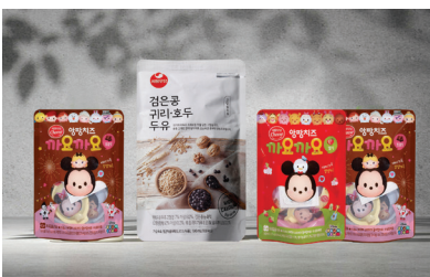
서울우유 삼방 스탠드