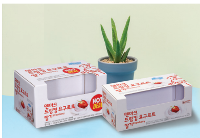
B형 삼면 창문