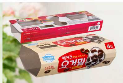
슬리브형 창문 띠지