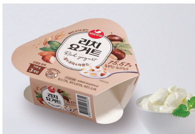
조립형 삼각 띠지