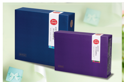
C형 상·하 선물세트