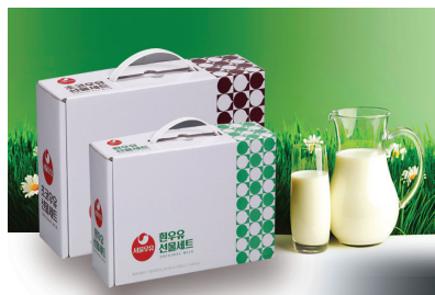
W형 손잡이 박스