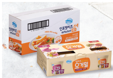
B형 삼면 창문