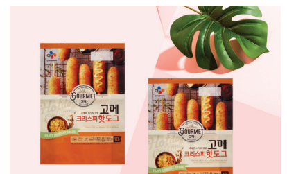
CJ 삼방 스탠드