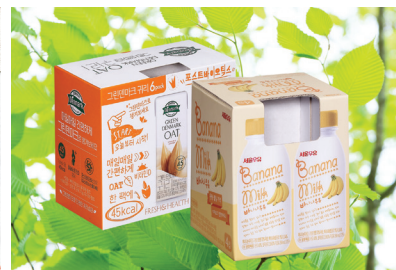
B형 삼면 창문