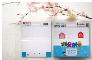
서울우유 해더 봉투